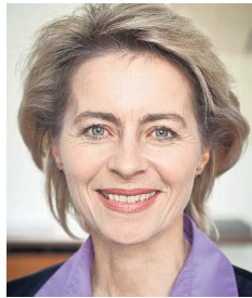
Senta Berger (Jahrgang 1941), Joachim Löw (Jahrgang 1960) Kathryn Bigelow (Jahrgang 1951), Alexander Kluge (Jahrgang 1932), Christoph Waltz (Jahrgang 1956), Blondie (Jahrgang 1945), Clint Eastwood (Jahrgang 1930), Ursula von der Leyen (Jahrgang 1958)